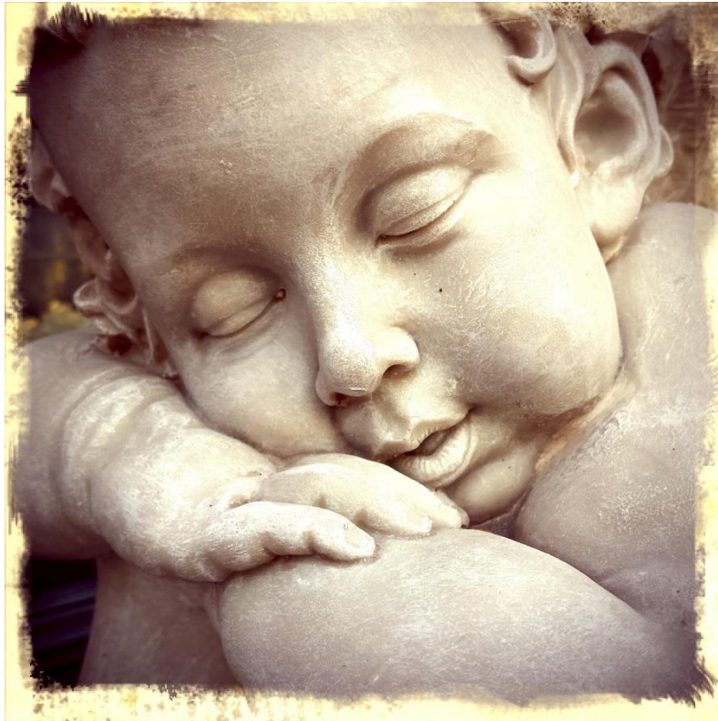
RetroCamera-App / Hipstamatic von Urban, Kamerafilter „The Little OrangeBox“, Samsung Galaxy S4